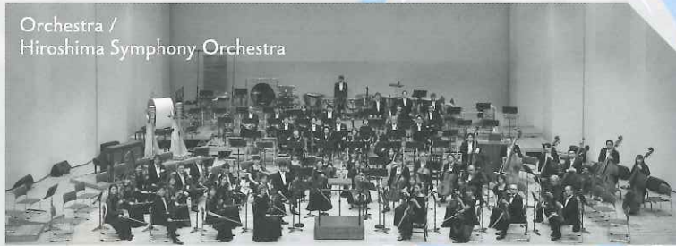
Orchestra / Hiroshima Symphony Orchestra

国際平和文化都市「広島」を拠点に「Music for Peace～音楽で平和を～」を旗印として活動するプロオーケストラ。2024年よりクリスティアン・アルミンクが音楽監督を務める。1963年「広島市民交響楽団」として設立、1970年に「広島交響楽団」へ改称。学校での音楽鑑賞教室や社会貢献活動にも積極的に取り組み、地域に根差した楽団として「広響」の愛称で親しまれる。