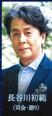
長谷川初範 (司会・語り)

ホテルニューオータニ 「SATSUKI」 クリスマス特別ディナープラン 限定:30席(12月21日、22日 各日とも) 料金:各券種+6,500円(税込)