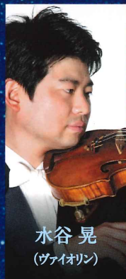
水谷 晃 (ヴァイオリン)