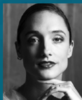
ドロテ・ジルペール (エトワール)